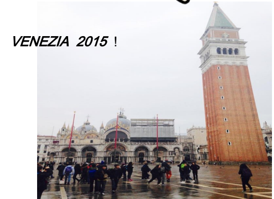
VENEZIA 2015 !